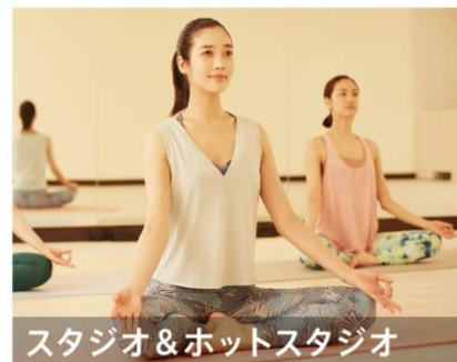
スタジオ&ホットスタジオ