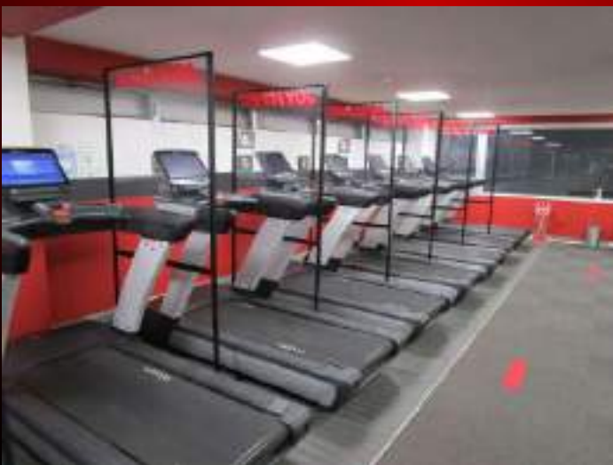
ランニングマシン(8台)