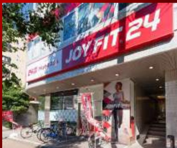
無料駐輪場・バイク125CCまで可