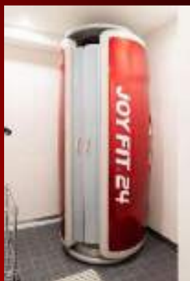
タンニングマシン(日焼けマシン)