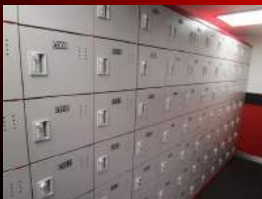
個人契約ロッカー