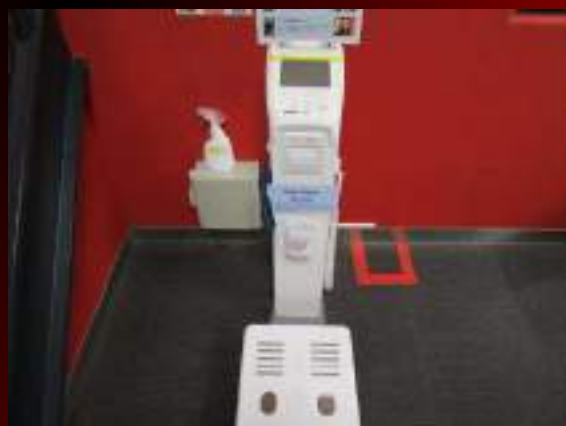
ボディプランナー(体組成計)