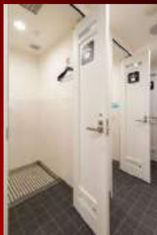
更衣室(男女2つずつ)