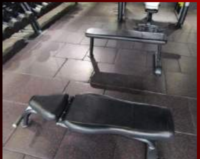
フラット&アジャスタブルベンチ