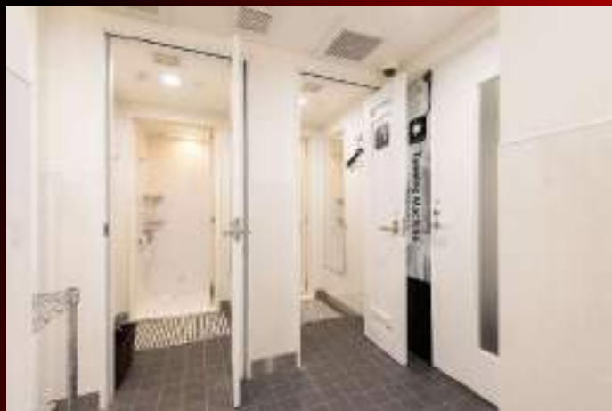
シャワールーム(男女2つずつ)