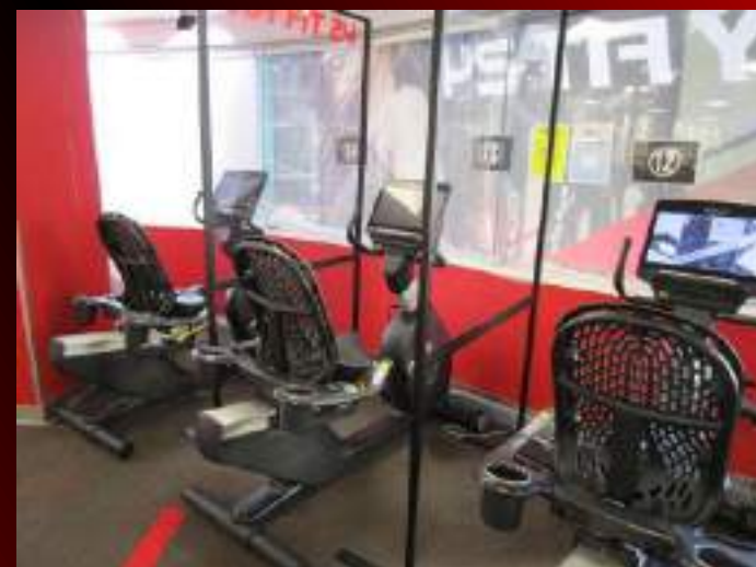
リカレントバイク(3台)