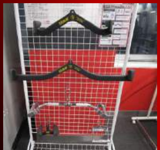
マググリップ・ケーブルアタッチメント