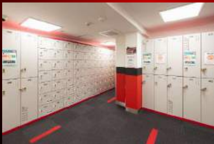
鍵付きの共有ロッカー