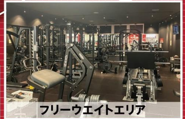
フリーウエイトエリア