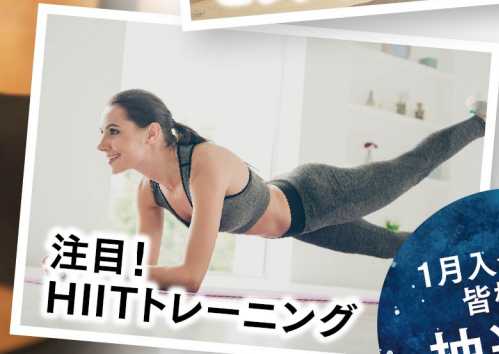
注目! HIITトレーニング