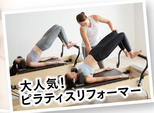
大人気! ピラティスリフォーマー