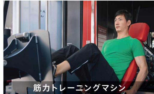
筋力トレーニングマシン

ランニングマシン、バイクマシン、アセントレーナーなど多様な有酸素マシンをラインナップ。運動不足解消やダイエットなど様々な効果が期待できます。