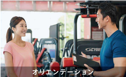
オリエンテーション

週にどれくらいトレーニングすればいいの? マシンの使い方は? 重さ・負荷はどのくらい? などの疑問にトレーナーが1対1でお答えします! 初めの方でも安心です。 ※予約が必要です。 ※詳しくはお問い合わせください。