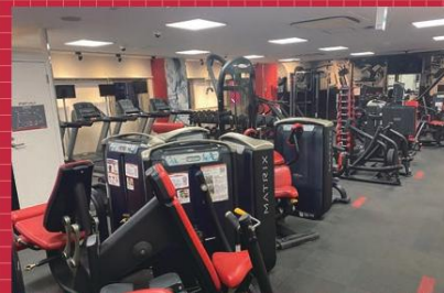
筋力トレーニングマシン

※各種オプション(契約ロッカーを除く)はすべて自動付帯でございます。ご不要な場合は無料期間内にご解約の手続きをお願いいたします。