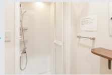
シャワー、お着替え