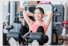
本格マシンで トレーニング