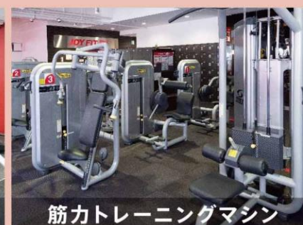
筋力トレーニングマシン

ランニングマシン、バイクマシンなど多様な有酸素マシンをラインナップ。運動不足解消やダイエットなど様々な効果が期待できます。