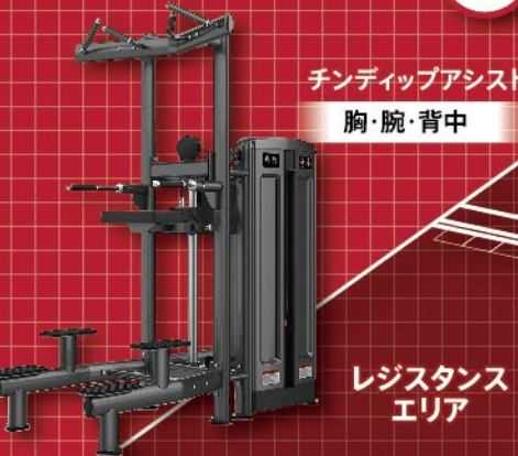
チンディップアシスト 胸・腕・背中