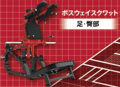
ポスウェイクワット 足・臀部