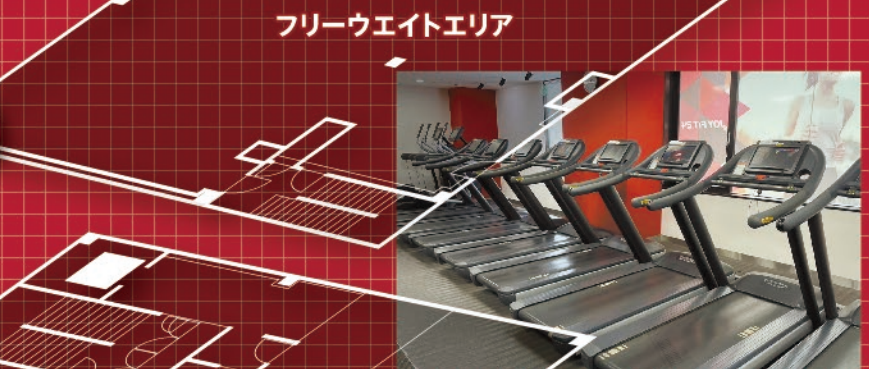
フリーウエイトエリア