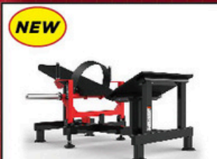
ブトックスブリッジ