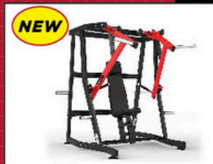
デクラインベンチプレス

ランニングマシン、バイクマシン、 エリプティカルトレーナーなど 多様な有酸素マシンをライン ナップ。運動不足解消やダイエット など様々な効果が期待できます。