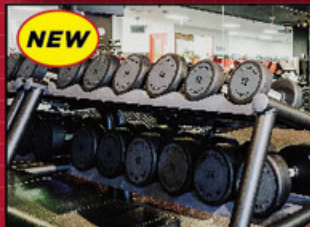
ダンベル50Kgまで導入!