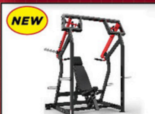
ショルダープレス