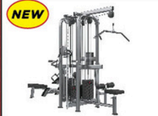
マルチジャングル4スタック