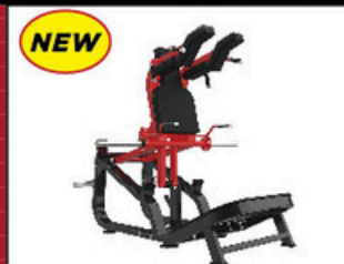
ポスウェイトスクワット