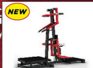
ラテラルレイズ/リアデルト