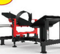
ボックスブリッジ