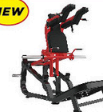
ポストワークアウト