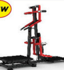
ラテラルレイズ/リアデルト