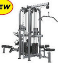
マルチジャングル4スタック