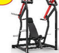
ショルダープレス