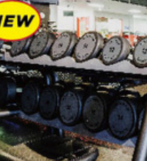
ダンベル50Kgまで導入!