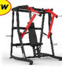
デクラインベンチプレス