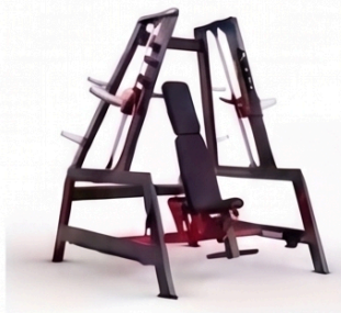
デュアルタワー スミスマシン