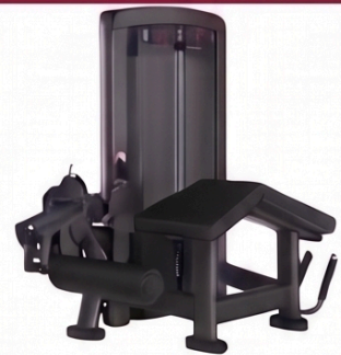
レッグカール/ レッグエクステンション