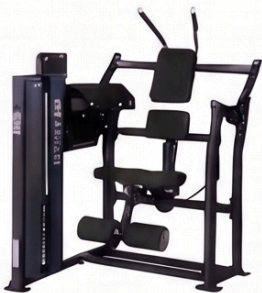
アブドミナルクランチ