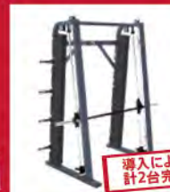
導入により 計2台完備