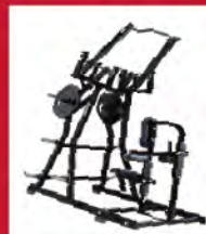
PL-フロントプルダウン