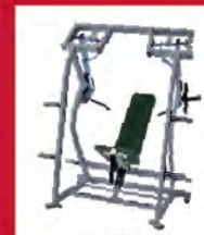
PL-ショルダープレス