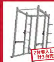
2台導入により 計3台完備