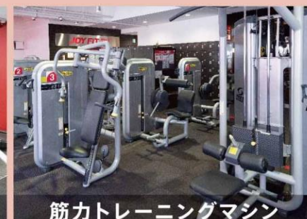
筋力トレーニングマシン

ランニングマシン、バイクマシンなど多様な有酸素マシンをラインナップ。運動不足解消やダイエットなど様々な効果が期待できます。