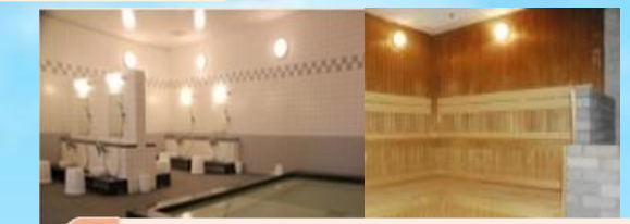
4 お風呂・サウナでリフレッシュ♪