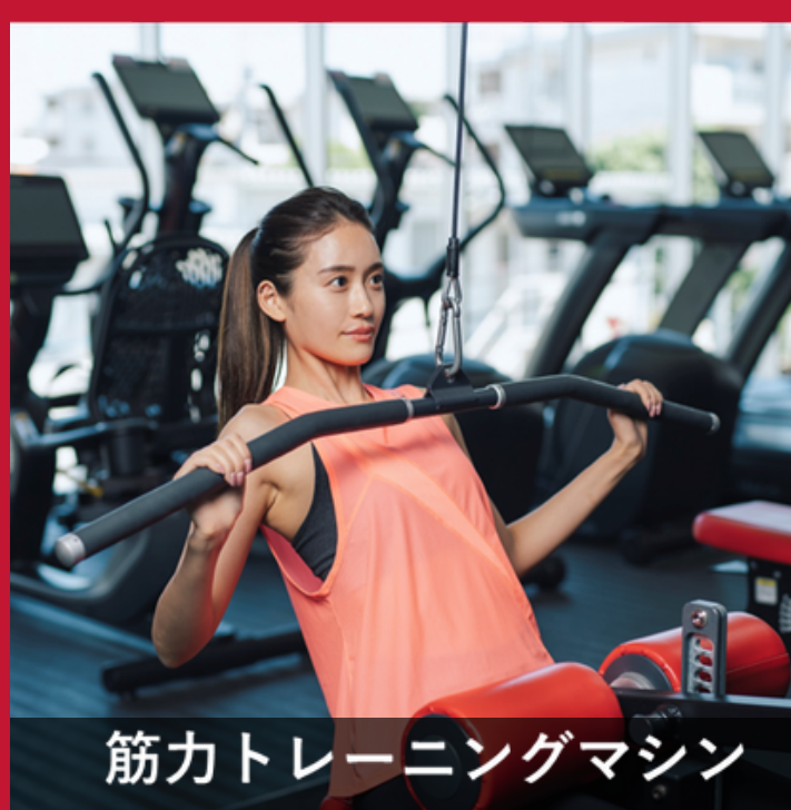
筋力トレーニングマシン