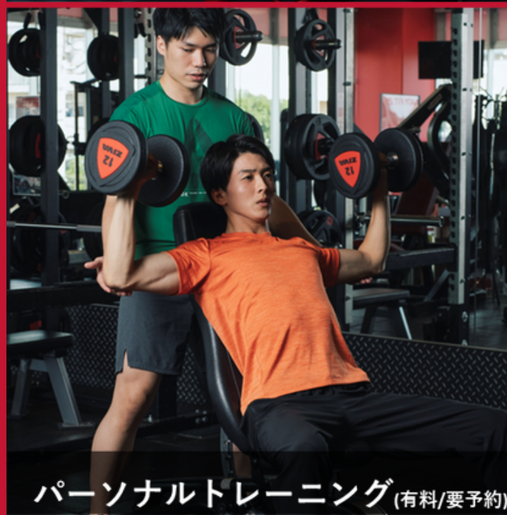
パーソナルトレーニング (有料/要予約)