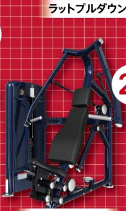
ラットプルダウン