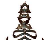
ケーブルアタッチメント