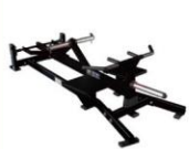
プレートロード・ Tバーロー