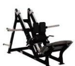
プレートロード・ リニアハックスクワット