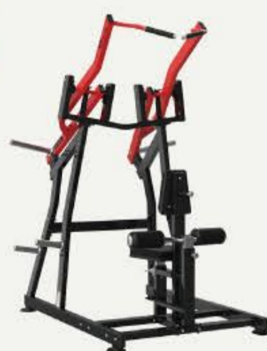
フロント ラットプルダウン