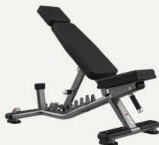
アジャスタブルベンチA