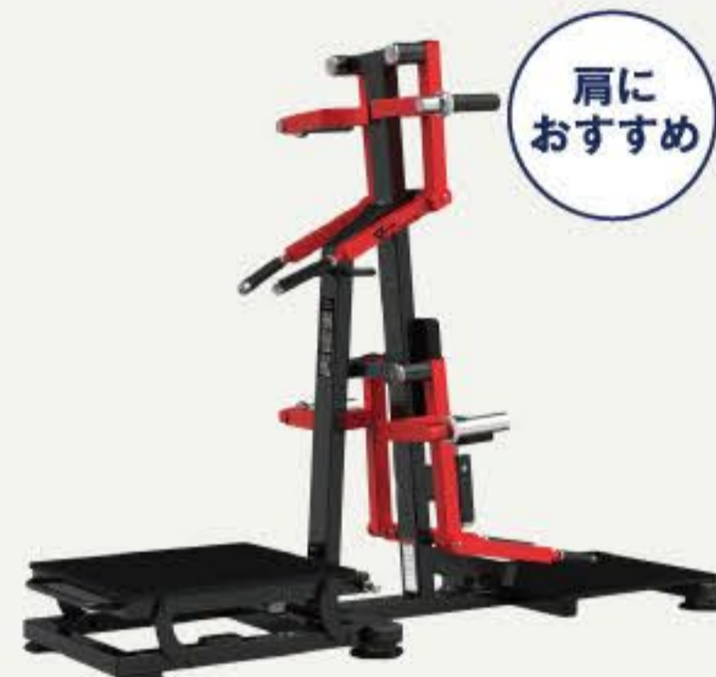
ラテラルレイズ リアデルトイド