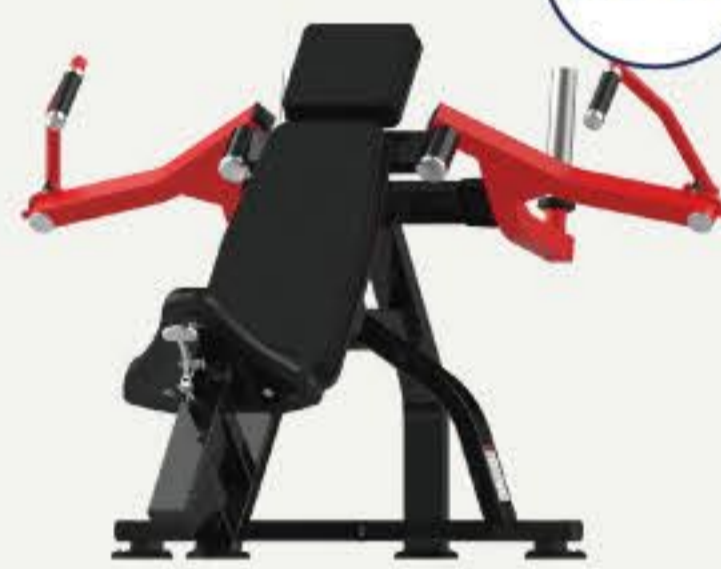
ペクトラルフライ