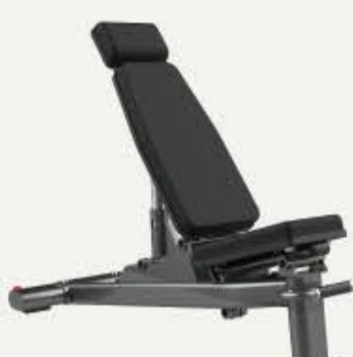
アジャスタブルベンチB