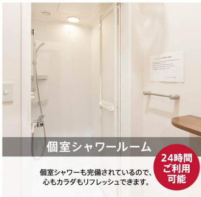
個室シャワールーム

有酸素マシンから筋トレマシン、フリーウエイトまで幅広くラインナップ。台数も豊富なので、待たずにいつでも思う存分トレーニング。