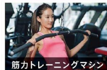
筋力トレーニングマシン

カッコいいカラダにこだわりたい方へ。 パワーラック・ベンチ・スミスマシンを備え、 バリエーション豊かな トレーニングができます。