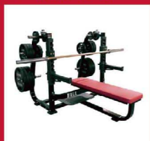
オリンピックベンチ