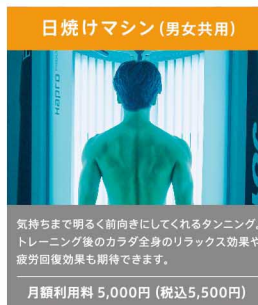
日焼けマシン(男女共用)

気持ちまで明るく前向きにしてくれるタンニング、トレーニング後のカラダ全体のリラックス効果や疲労回復効果も期待できます。 月額利用料 5,000円(税込5,500円)