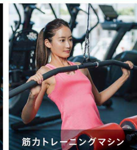
筋力トレーニングマシン