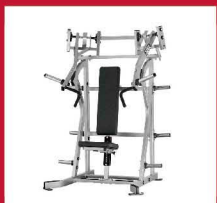
インクラインプレス