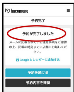
【予約完了】が表示されれば予約は完了しております。