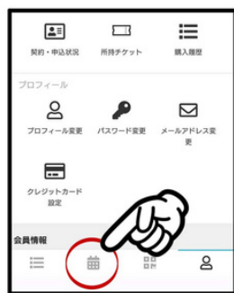
「会員情報」の中にあるカレンダーのマークをクリック