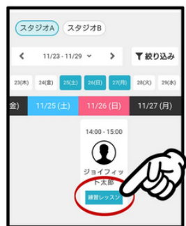
入りたいレッスンを選択する