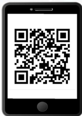
QRコードを読み取りサイトにアクセス