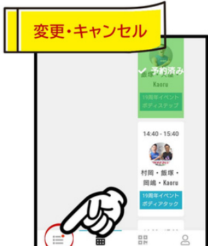
レッスンをキャンセルしたいときや受講するスタジオ内の立ち位置を変更したいときは左下の三本線をクリック