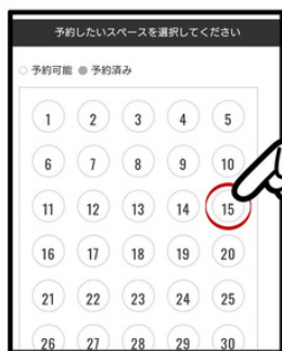
レッスンを受講するスタジオ内の立ち位置を選択する