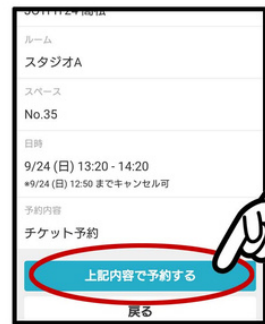
予約内容で間違いがなければ【上記内容で予約する】をクリックする