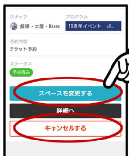
該当する項目をクリック