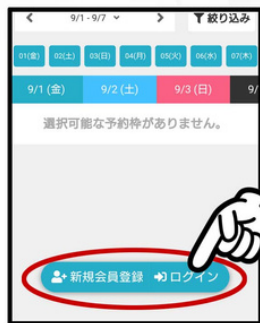
ジョイフィット高松のhacomonoページから【新規会員登録】をクリックする