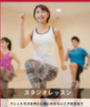
スタジオレッスン