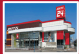
香川県高松市上天神町510番地1