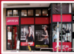
香川県高松市丸亀町13-3 丸亀町参番街東館1F